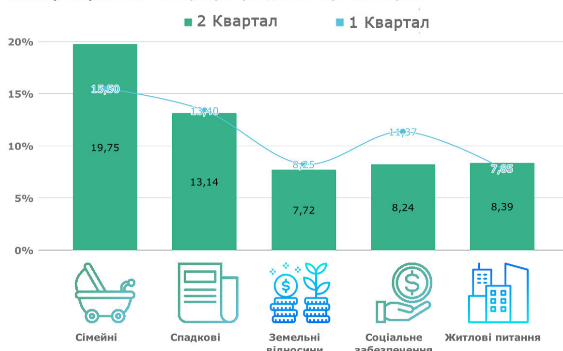
Категорії справ 2 кв. 2019 року з трендом за перший квартал

За цим графіком, ми можемо спостерігати що на 4,25 % збільшилась кількість сімейних справ , за якими звертаються до офісів Мережі правового розвитку. Це можна пояснити тим, що наближається період відпусток і батьки звертаються з метою з'ясування питань щодо вивезення дитини за межі України.